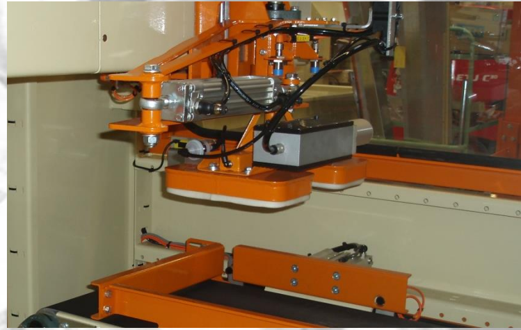
Vacuum stacking unit.