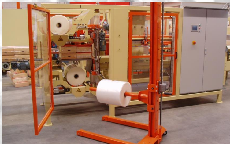
Packaging made out of stretch foil on a roll